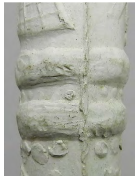
Afb. 6. Oneffenheden en lijntjes op de twee banden.