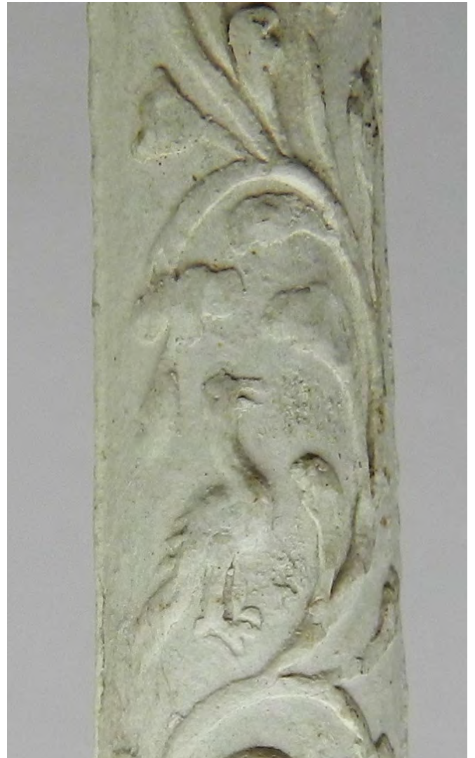
Afb. 4a-b. Vogels (duiven?) tussen bladranken.