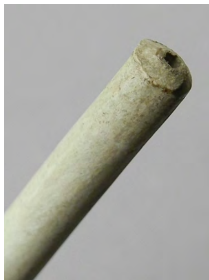
Afb. 5a-b. De opening voor de sigaar en het mondstuk.