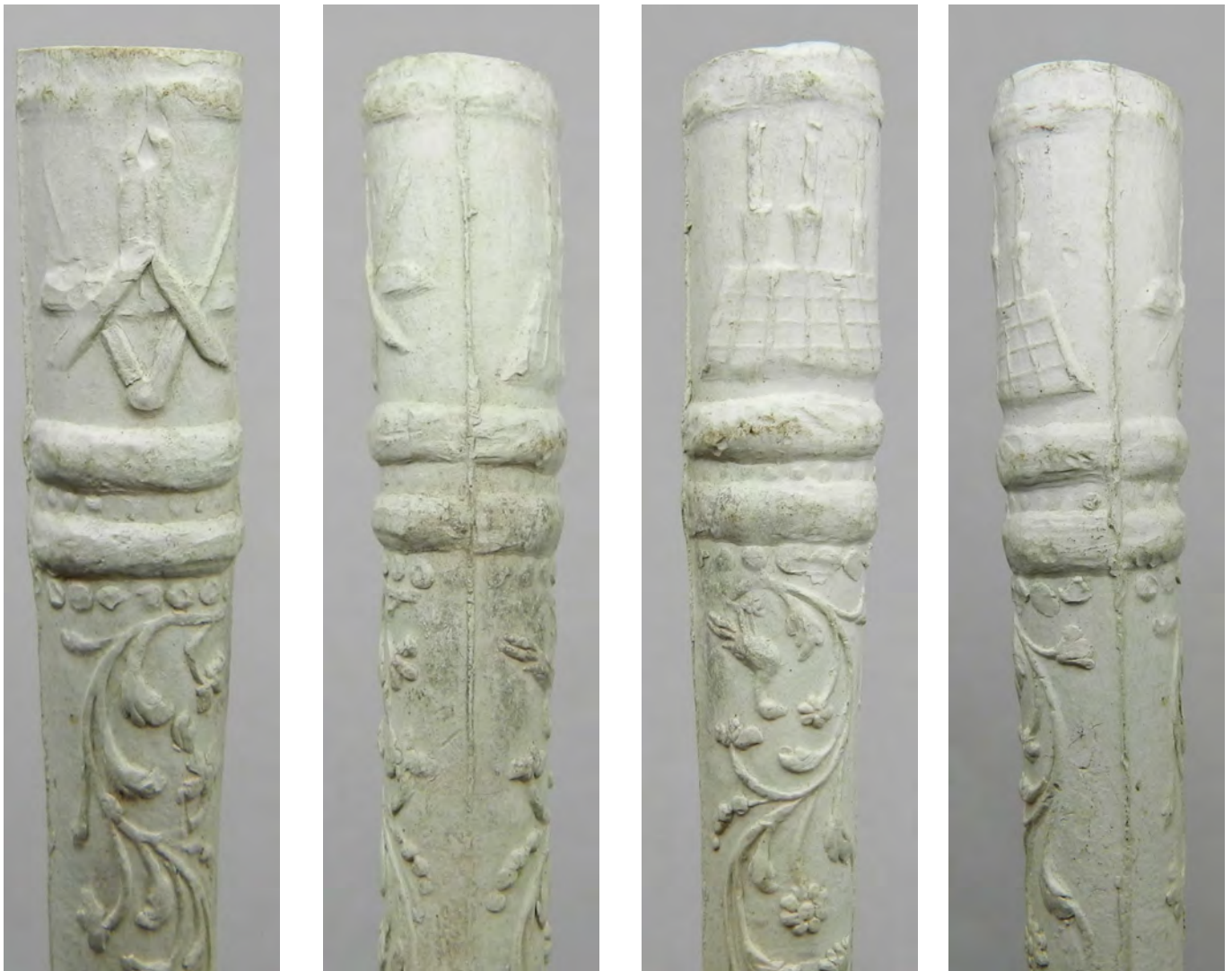
Afb. 3a-d. Ketel van de sigarenpijp met maçonnieke symbolen, twee gladde banden en daaronder bladranken met bloemen en vogel.

is respectievelijk 0,9 en 1,2 cm. De pijp vertoont geen gebruikssporen en is niet geglaasd. Ook het feit dat deze wat krom is duidt op een mindere kwaliteit dan die van de eerder beschreven pijpen. Ook lijkt de decoratie van deze pijp wat slijtage te vertonen door veelvuldig gebruik van de mal.