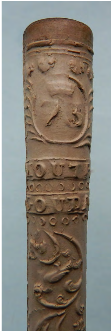
Afb. 7a-b. Sigarenpijp met de symbolen van de vrijmetselarij en de Van Houten-pijp.